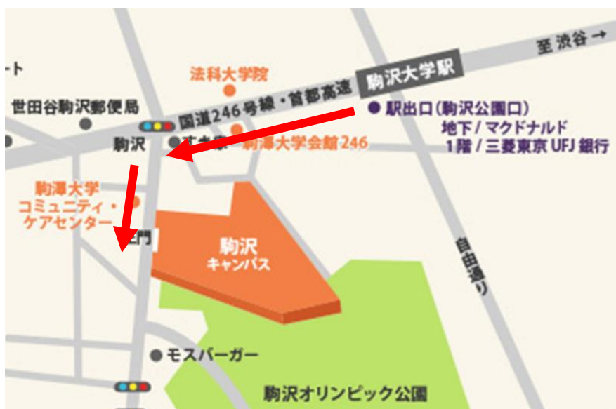
最寄駅（駒沢大学駅）から大学正門までの経路